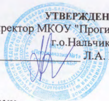
График получения пищи на пищеблоке